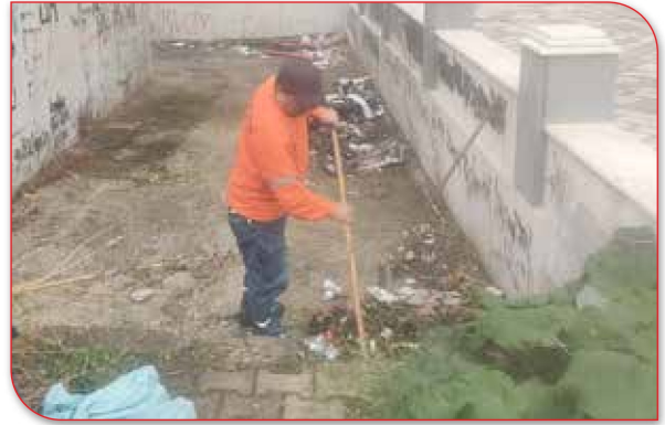
İlçe Geneli İzinsiz Atılan Çöplerin Toplanması