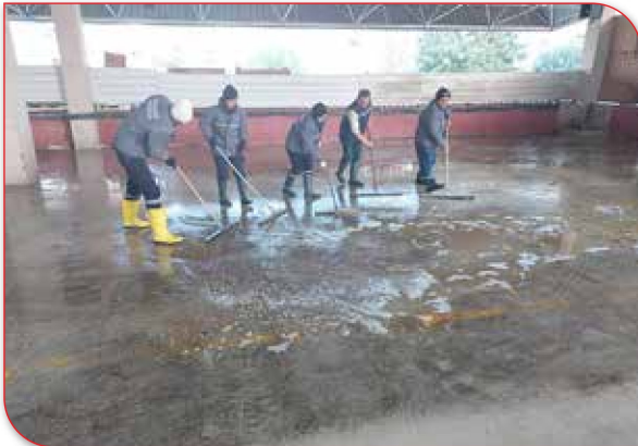
Pazaryerlerimizin Temizlik ve Dezenfeksiyon İşleri