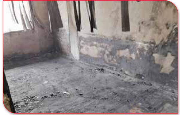
Yangın Sonrasında Temizlik Ekiplerimizin Alan Tespitleri