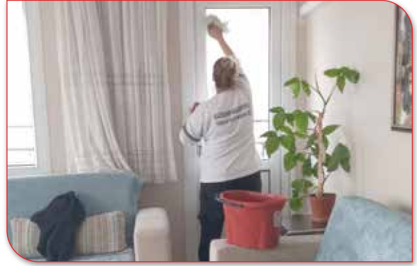
İhtiyaç Sahibi / Engelli Vatandaşlarımızın Evlerinin Temizliği