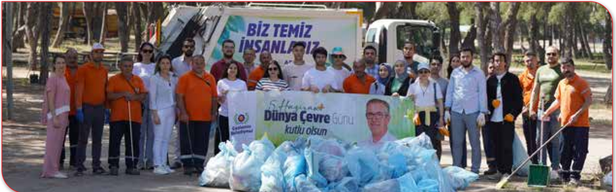
Dünya Temizlik Günü Kapsamında Yapılan Etkinlik