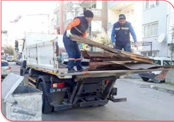
Ev Eşyaları ve Mobilya Atıklarının Toplanması

Müdürlük personellerimizce yapılan muhtelif çalışmaların görselleri aşağıda ve müteakip sayfada verilmiştir.